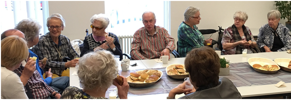
Voorleeslunch in de bibliotheek in Voorburg op Nationale Ouderendag