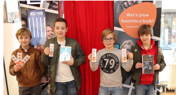
Bezoekers van de bibliotheek konden in een fotohokje op de foto met hun favoriete e-book

Digitale diensten en producten worden steeds belangrijker in onze maatschappij. De bibliotheek biedt haar leden een grote digitale collectie aan. Ook het aantal digitale diensten groeit en voorziet in een grote behoefte.