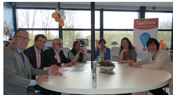
Ondertekening van de intentieverklaring Taalhuis Leidschendam-Voorburg

Onder grote belangstelling werden in april de taalhuizen in Leidschendam-Voorburg en Rijswijk geopend. De taalhuizen richten zich op Nederlanders die niet of nauwelijks kunnen lezen en schrijven en op niet-Nederlanders die de taal willen leren. De bibliotheek zet hiermee samen met de partners een goede stap in de bestrijding van laaggeletterdheid. Speciaal opgeleide vrijwilligers houden wekelijks spreekuren in de verschillende taalhuizen. De vrijwilligers bekijken welke taalbehoefte de taalvrager heeft en verwijzen dan door naar de meest geschikte taalaanbieder. De taalhuizen hielpen in acht maanden tijd 320 bezoekers met hun taalvraag.