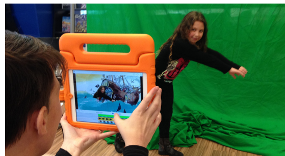
Greenscreen tijdens het Kinderboekenweekfeest