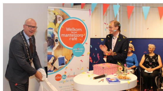
Opening van het Mantelzorgcafé in Voorburg