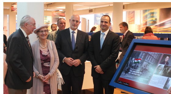
Onthulling van de digitale presentatie over de Hongaarse Opstand van 1956