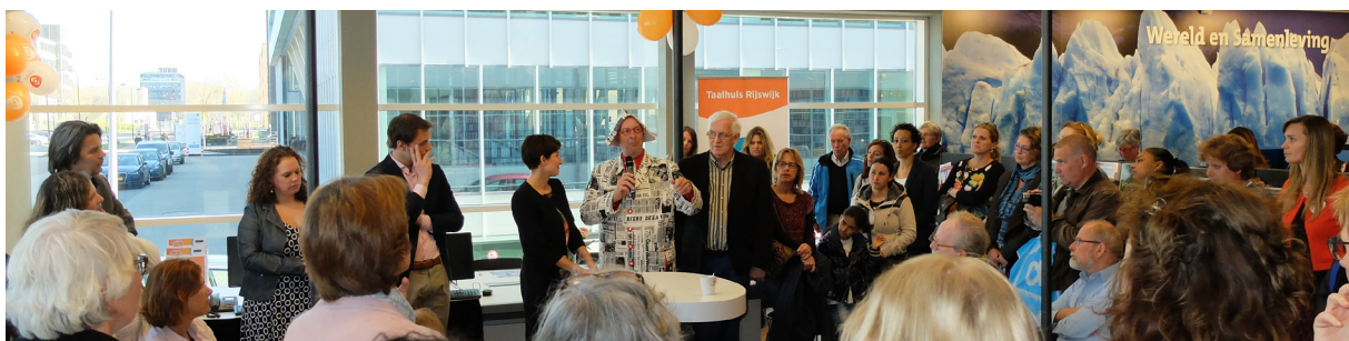
Grote belangstelling bij de opening van het Taalhuis in Rijswijk