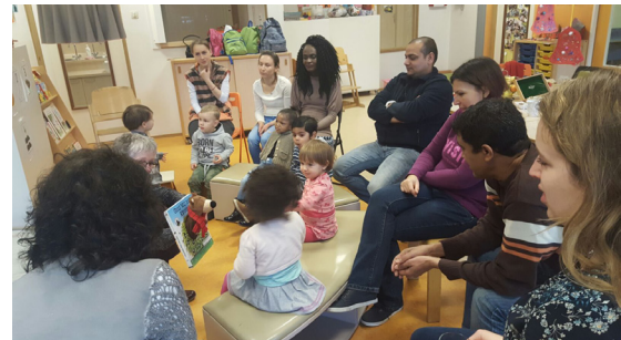
Speelstart ouderbijeenkomst bij kinderopvang DoReMi in Rijswijk