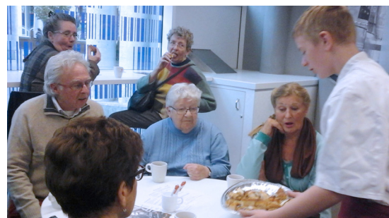
Leerlingen van het Stanislascollege delen hapjes uit aan de bezoekers van het Filmhuis

Najaar 2015 was de start van de regionale campagne 'Allemaal digitaal!'. Het doel van de campagne was, en is, ouderen digitaal vaardig(er) te maken. De bibliotheek werkt al jaren samen met SeniorWeb bij het aanbieden van cursussen over computers, tablets en smartphones. De communicatie met de overheid, online bankieren en 'webwinkelen' maken het noodzakelijk dat iedereen digitaal vaardig wordt. Daarom breidden wij in 2016 ons aanbod uit met de cursussen 'Klik & Tik, wegwijs met de computer en internet' en de Digisterker-cursus 'Hoe werkt de digitale overheid?'. In kleine groepen werd er intensief geoefend op de computers. Voor de Digisterker-cursus faciliteerde de bibliotheek een officiële Digisterker-training voor de docenten.