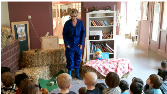
Voorlezen tijdens de Nationale Voorleesdagen

Het hele jaar door vonden er activiteiten plaats in de bibliotheek, voor peuters en kleuters, maar ook voor jeugd tot 12 jaar. Natuurlijk werd er voor peuters en kleuters weer aandacht besteed aan de Nationale Voorleesdagen, waar het prentenboek 'We hebben er een geitje bij' centraal stond. Ook het peutervoorlezen trok weer veel publiek en vanaf september wordt er nu ook in Rijswijk om de twee weken voorgelezen. Nieuw dit jaar was de Sinterklaasactie, waarbij de kleintjes een klein boekje cadeau kregen in hun zelf geknutselde schoentjes.