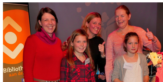
Voorleeskampioenen van de Bibliotheek aan de Vliet