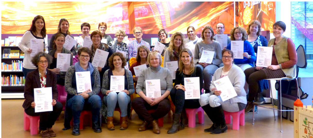
Certificaatuitreiking van de cursus Open Boek

“De ervaring van de eerste drie trainingen van Schrijvers aan leerkrachten leert ons dat onze Schrijvers leerkrachten inspireren en motiveren om het schrijf- en leesonderwijs op een creatieve manier aan te pakken. De Schrijvers geven leerkrachten nieuwe ideeën, nieuwe inzichten en vooral ook: praktische handvatten voor niet-methodisch, creatief en effectief lees- en schrijfonderwijs.”