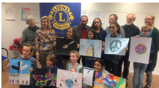
Prijzuitreiking van de Vredesposterwedstrijd georganiseerd door de "Lions Club International"