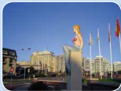
Hotels in Noordwijk