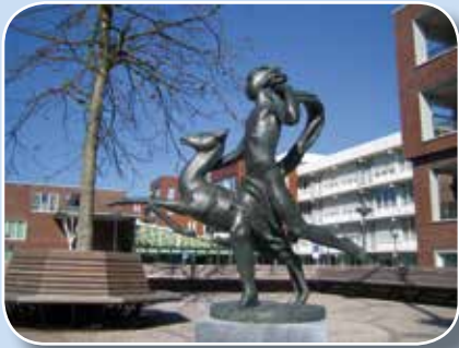
Rennend naakt met hinde