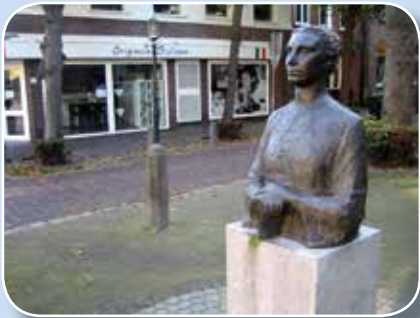
Henriëtte Roland Holst

Hoe mooi ook, zonder zorgen bleek Noordwijk-Binnen niet. Ik wilde er het rustiek ogende hotel Hof van Holland binnengaan, maar het was gesloten. Al met vakantie misschien? Nee, failliet, vertelde een winkelier uit de Voorstraat. Hij nam meteen de gelegenheid te baat al zijn zorgen over de Voorstraat met me te delen. Het is ook het duurste straatje van Nederland, waarschuwde hij nadat ik de schoonheid ervan had geprezen. Middenstanders trekken er weg, rijke mensen kopen hun panden op. De loop is eruit, zuchtte hij, de Voorstraat dreigt een dood straatje te worden.