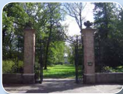
Park Vreugd en Rust

Leidschendam werd in 2010 ineens wereldnieuws omdat er het Sierra Leone tribunaal werd gevestigd waar het beroemde model Naomi Campbell werd opgeroepen om te getuigen in het